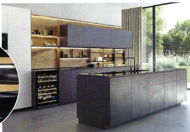
Der Diwa Klimaschrank „AVU61DHD“ fasst 54 Flaschen.